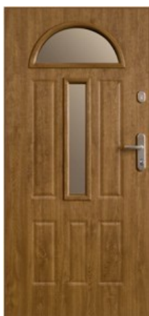
W93 Werona 3