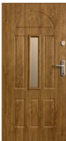
W91 Werona 1